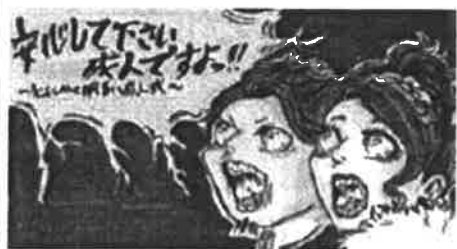
平成28年度 実行委員会作成